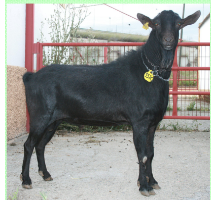
Semental de cuatro años de Raza Murciano-Granadina