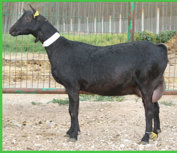
Reproductora primípara de la Raza Murciano-Granadina